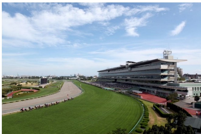
J R A 阪神競馬場イメージ

== 高速道経由 == 米子駅前だんだん広場 == 松江駅南口 == 一畑バス本社 19:55 20:45 20:55