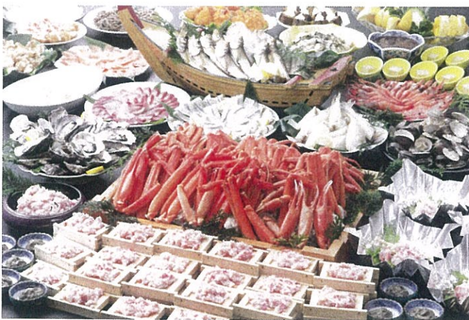
かに食べ放題料理イメージ

出雲市駅北口7:00==宍道ベル7:30==松江駅南口8:00== ==浜坂(ゆで足・焼きがに等の50分かに食べ放題のご昼食とお買物)== ==湯村温泉(散策)==ちくわのまえた(お買物)==お菓子の壽城(お買物)== ==松江駅南口18:15==宍道ベル18:45==出雲市駅北口19:15