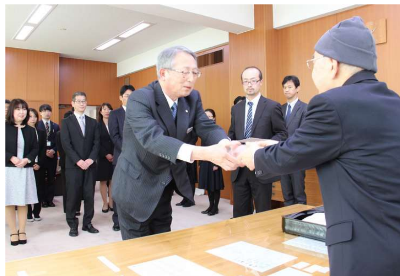
しまね女性の活躍応援企業 平成30年2月16日知事表彰受賞