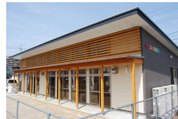
企業主導型保育所「キッズいちばた」