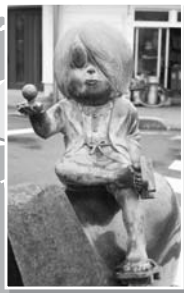
境港市観光案内所 (境港駅前みなとさかい交流館内)